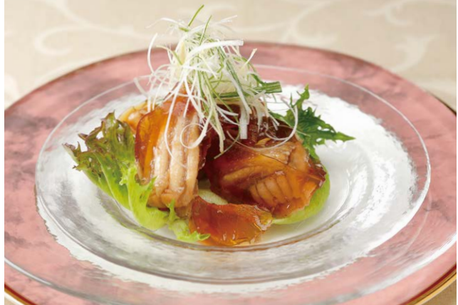
夢酒ダイニング「なかり」のメニューでもお楽しみいただけます(要予約)