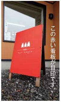
この赤い看板が目印です。

白老観光商業協同組合は73年に創立、75年に開館した白老民芸会館がそのルーツとなる。開館当時は52店舗が軒を連ね、年間87万人もの観光客が訪れていたという。その後バブル経済の崩壊などで道内観光客の落ち込みと共に、建物の老朽化も重なり09年に閉館となった。20年にウポポイがオープンし、再び多くの観光客が訪れる一大観光スポットとして白老が注目される様になった。そんな中で、地元白老ならではの独自のアイヌ文化や工芸品をもっと広くみんなに知ってもらいたい、という思いから、町のチャレンジ枠を利用して昨年4月にポンエペレをオープンした。店内には、町内で作られた伝統工芸品や日常使いやすいアイヌ雑貨をはじめ、Tシャツやアクセサリーなど、地元の作家さんが多くの商品を提供している。アイヌ文化伝承、保存に尽力されている作家、山崎シマ子さんの伝統的な民具や工芸品も並ぶ。ぜひ一度訪ねて見てください。